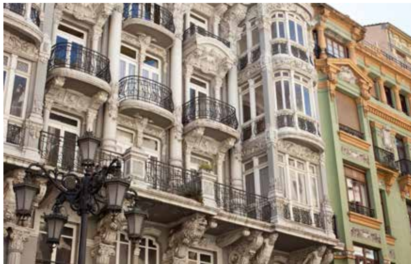
Casas del Cuitu.

Las Casas del Cuitu en los números 27-29 de dicha calle. Son obra de un arquitecto palentino, Nicolás García Rivero (1853-1923) que nos dejó también la construcción del Pa-