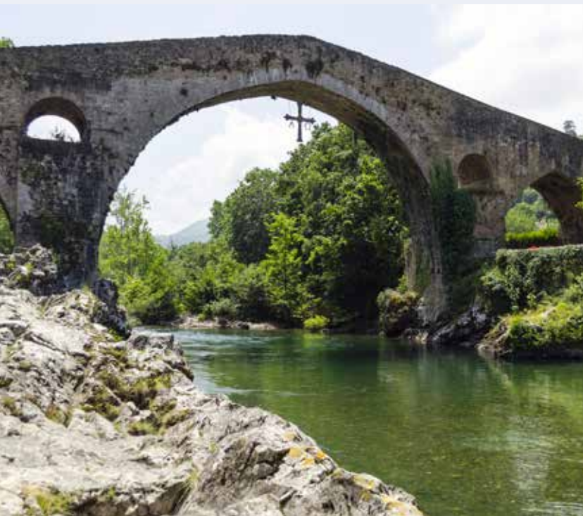
Cangas de Onís. Puente romano.