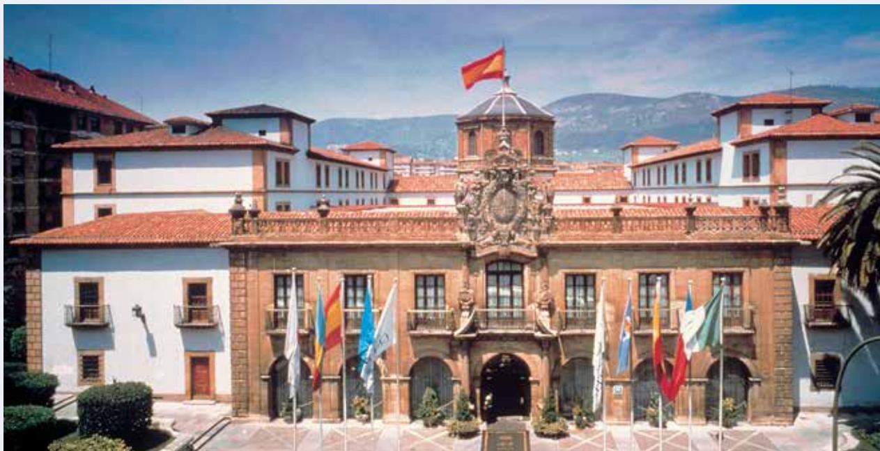
Hotel de la Reconquista.