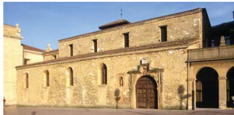
San Tirso el Real.

Volvamos a la plaza. Casi llegando al pórti-co, mirando a la derecha tenemos la iglesia de San Tirso el Real . Fue fundada por Al-fonso II el Casto en el siglo IX. Ha sufrido di-versas reconstrucciones y restauraciones, la última en el siglo XX. De la iglesia prerromá-nica primitiva sólo queda en pie el muro ca-beccero del ábside central, con una ventana ornada con alfiz. El campanario dispone de tres campanas siendo la más antigua la de la cofradía de San Pablo de 1797.