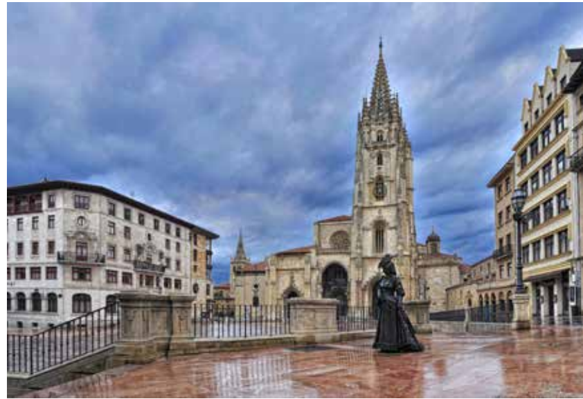
Plaza de la Catedral con la Regenta.

San Salvador se convierte con Santiago en principio o fin de las peregrinaciones, en paso obligado para los peregrinos, quienes gozaban, por visitarla, de un extraordinario jubileo. Por esto y por la cantidad y calidad de sus reliquias, el medioevo denominó a la ciudad como "Sancta Ovetensis".