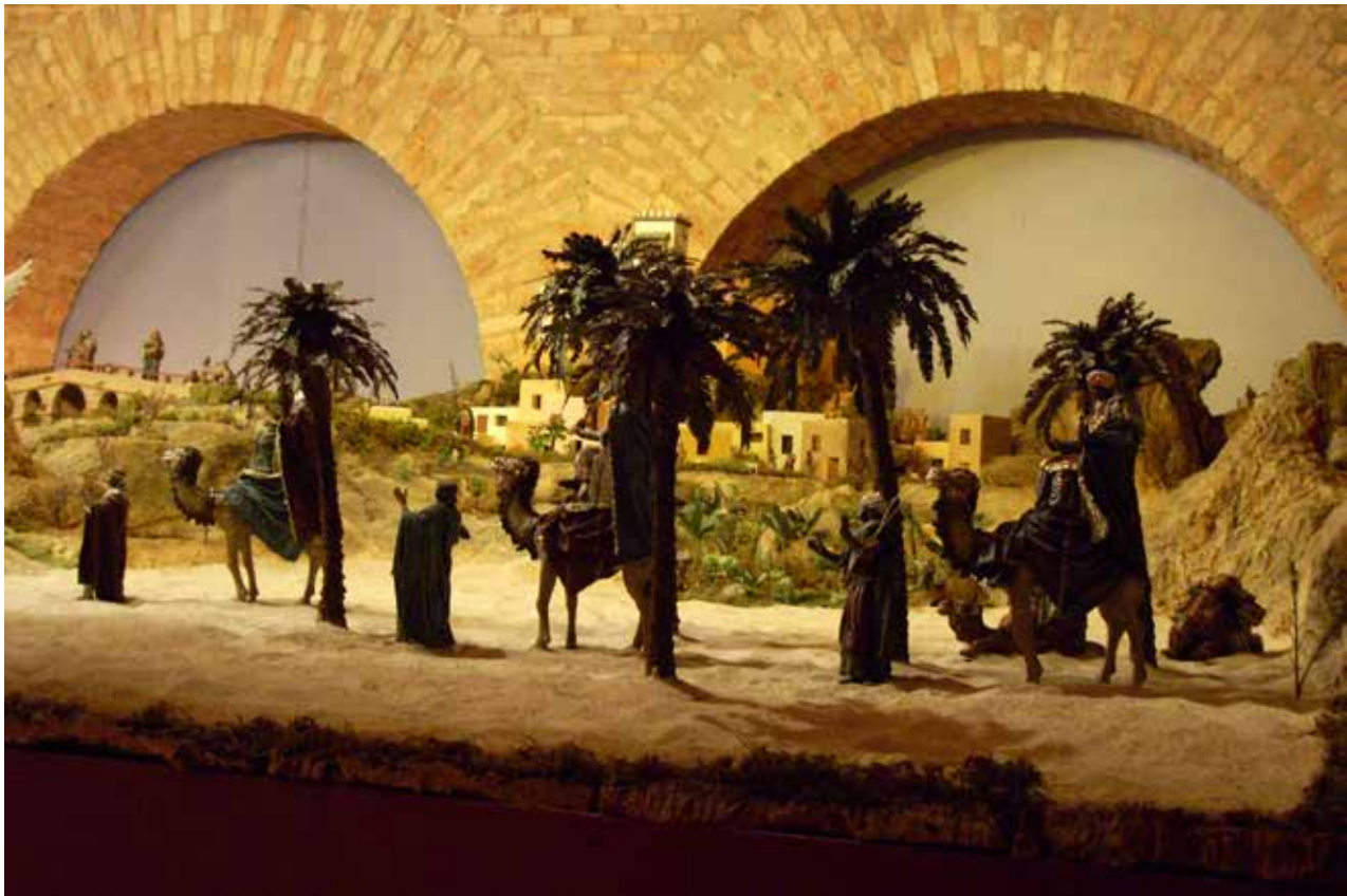
Cabalgata de Reyes del Belén Emblemático 2012.

El siguiente paso fue conseguir el Belén Emblemático de la Asociación Belenista de Oviedo . En su primer año se situó en el Sannatorio Miñor, con las figuras cedidas por D.