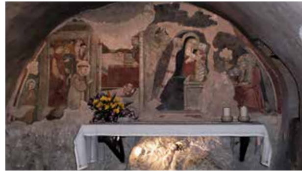
Greccio: Gruta del Nacimiento.

el pesebre un altar y se dedicó una iglesia, para que, donde en otro tiempo los animales pacieron el pienso de paja, allí coman los hombres de continuo, para salud de su alma y de su cuerpo, la carne del Cordero inmaculado e incontaminado, Jesucristo, Señor nuestro, quien se nos dio a sí mismo con sumo e inefable amor y que vive y reina con el Padre y el Espíritu Santo y es Dios eternamente glorioso por todos los siglos de los siglos. Amén. Aleluya. Aleluya.