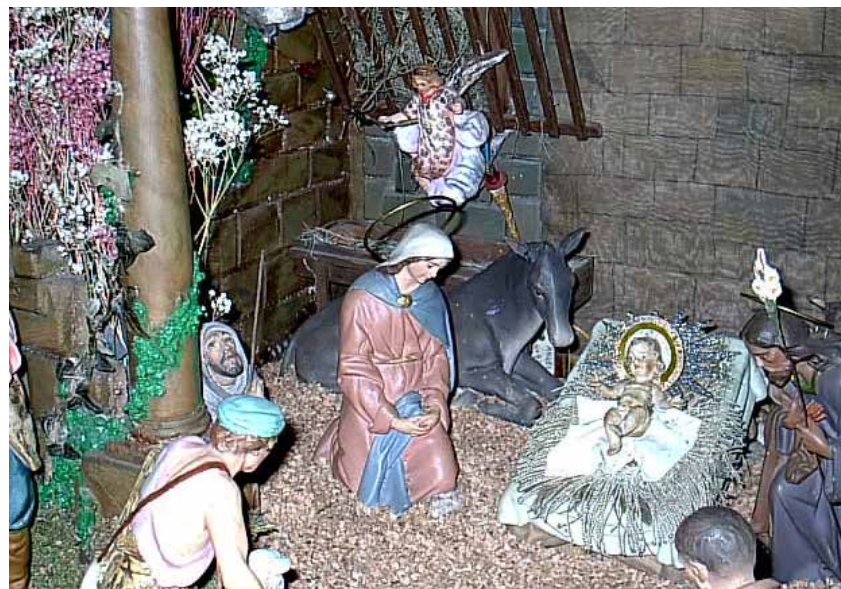
El Misterio del Belén de Lastres.