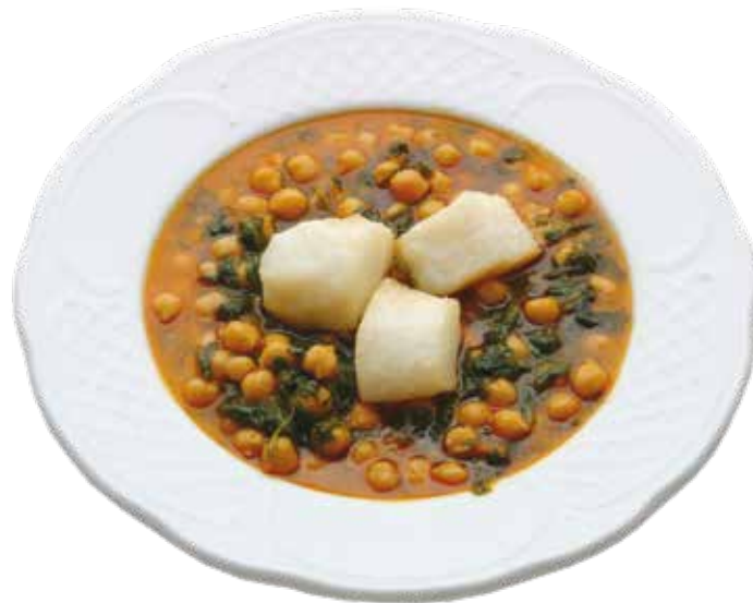
Menú del Desarme.

Se celebra comiendo un copioso menú que consiste en garbanzos con bacalao y espinacas, callos y arroz con leche. Lo sirven mu-