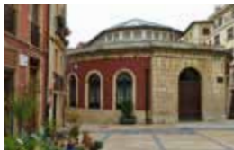
SALA DE EXPOSICIONES ANTIGUA PLAZA DEL PESCADO