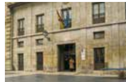
BIBLIOTECA DE ASTURIAS "RAMÓN PÉREZ DE AYALA"

ha creado un taller para la reparación de figuras y la elaboración de estructuras a lo que se invita a participar a todo el mundo; se ha abierto un servicio de asesoramiento para todo aquel que quiera aprender, con un poco de tiempo y sin grandes gastos, a preparar un bonito Belén en su propia casa. Se han organizado concursos de belenes en los escaparates en colaboración con un Centro comercial de Ribadeo. Se ha invitado también a que todo aquel que quiera enseñar su Belén, nos deje su dirección y las horas a las que está disponible, para que podamos incluirlo en la lista de belenes abiertos al público.